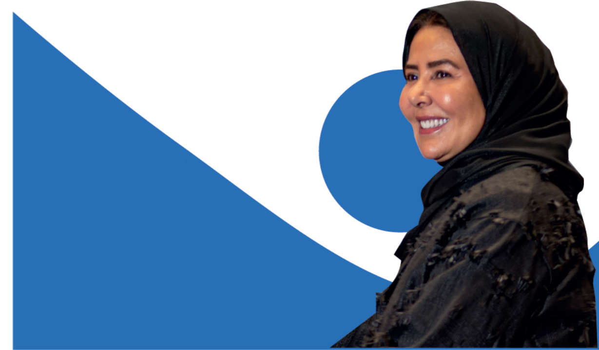
رئيس مجلس إدارة جمعية سند الخيرية صاحبة السمو الملكي الأميرة عادلة بنت عبدالله بن عبدالعزيز آل سعود

إن رؤية الجمعية في الوصول لكل طفل أصيب بمرض السرطان وتقديم المساندة له ولأسرته ، هي المنارة التي نستنير بها للتخطيط لبرامج الجمعية و متابعة آليات التطبيق وذلك تحقيقاً لأهدافنا بتوفير الدعم المادي و الإجتماعي و النفسي لأطفالنا ، و ذويهم خلال فترة العلاج